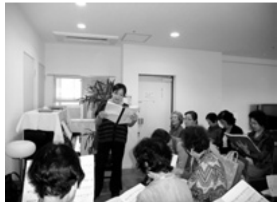
大変中身の濃い練習

員のリードのもと、元気に明るく練習に励み、歌声と笑い声がいっぱいの練習風景でした。