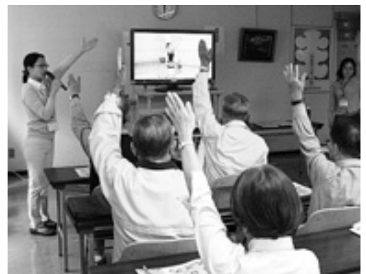
出席者全員で「はまちゃん体操」を体験

まちゃん体操」の指導がありました。ビデオを使い、座ったままでもできる体操を全員で楽しく行いました。