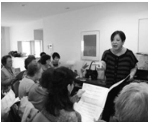
熱心に教える山口会員