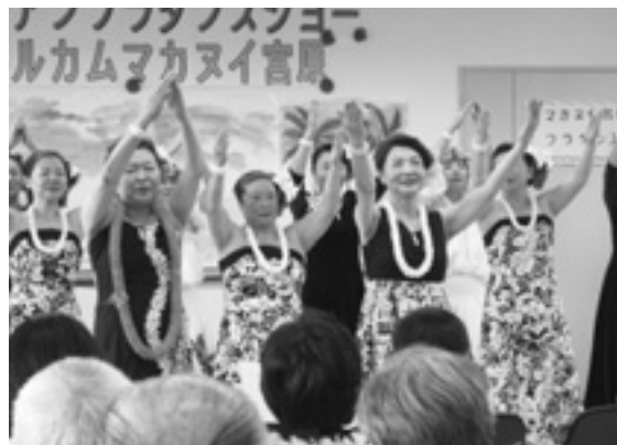
見上げてごらん夜の星を……♪