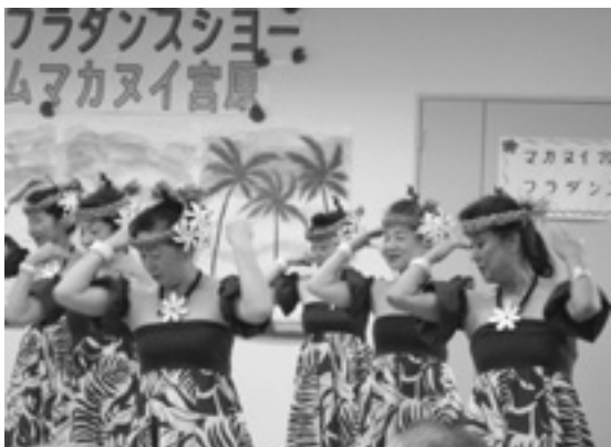
情景たっぷりの中で