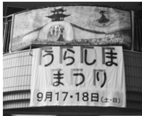
階段の壁には浦島伝説が絵巻で展示