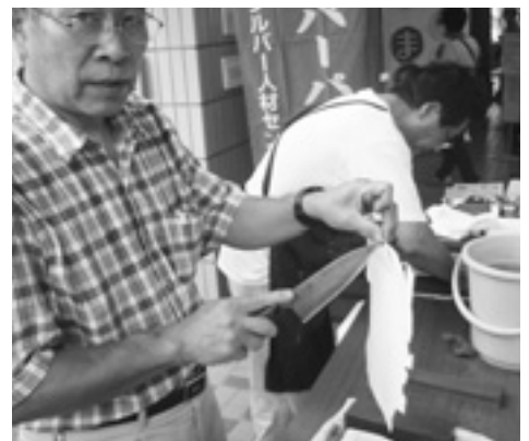
紙を切って切れ味の確認